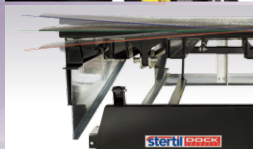
Het platform kan 125mm naar beide kanten torderen