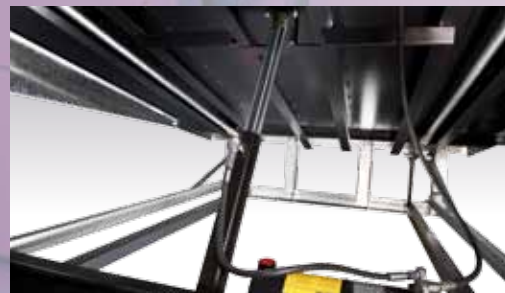
Een hydraulische (hoofd) cilinder