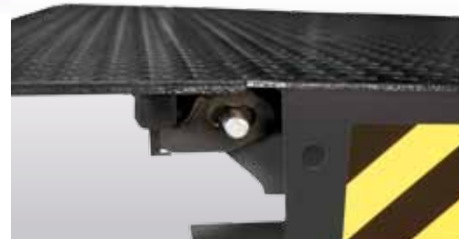
Altijd horizontale lip