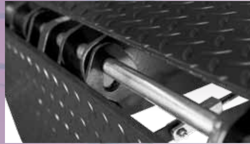
Unieke open lip scharnier