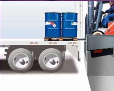
Onder dock positie